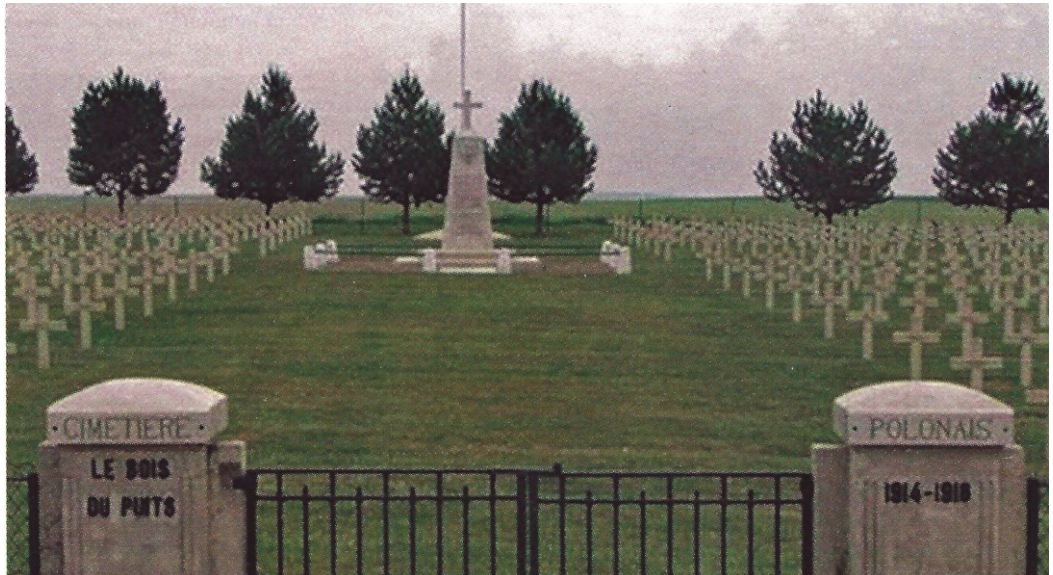
Cimetière militaire polonais du Bois du Puits, 385 tombes dont 129 de la Grande Guerre.

En France, une seule nécropole polonaise existe concernant les soldats morts pour la Patrie durant la Grande Guerre. Elle se situe dans le département de la Marne : la nécropole d'Auberive.