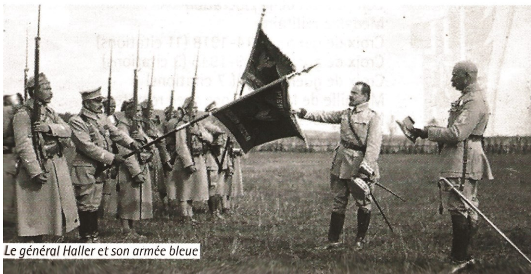
Le général Haller et son armée bleue