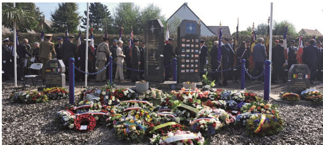
Texte et photos : Ambassade de République tchèque

L'événement s'est déroulé sous le patronage de la Fédération du Mémorial de l'OTAN, au monument qui a été inauguré cérémonieusement le 25 février 2012 et où les soldats tchèques qui ont sacrifié leur vie pour la paix et la liberté dans les opérations de l'Alliance ont un monument.