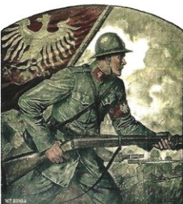
ARMIA POLSKA WE FRANCYI POLISH ARMY IN FRANCE

Après la révolution de 1917 en Russie, la France forme par un arrêté présidentiel du 4 juin 1917, une armée polonaise en France.