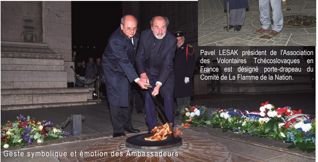
Geste symbolique et émotion des Ambassadeurs