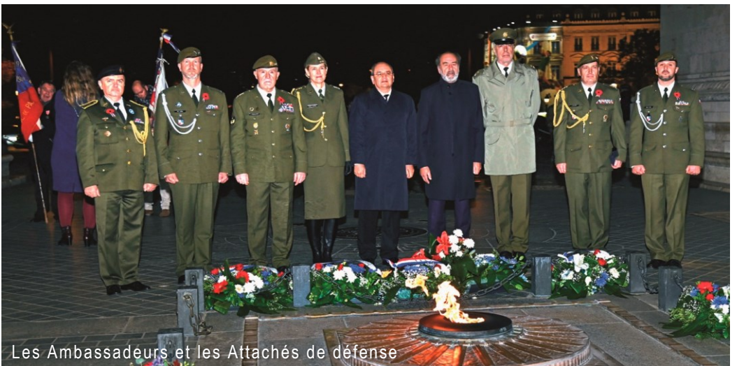
Les Ambassadeurs et les Attachés de défense