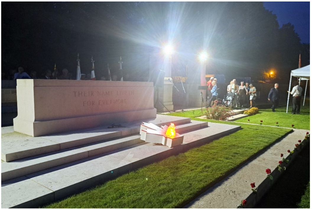
Ci-dessus : Cérémonie nocturne au cimetière canadien Ci-dessous : Cérémonie au pied de la citadelle de Dieppe