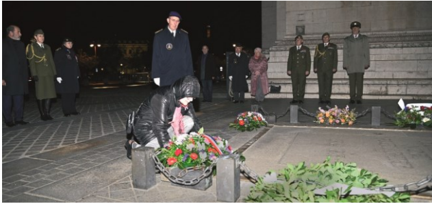
Dépôt de gerbe de l'A.V.T.F.

Le même jour sous l'Arc de Triomphe, hommages étaient rendus et les deux ambassadeurs ravivaient ensemble, la Flamme de la Nation.