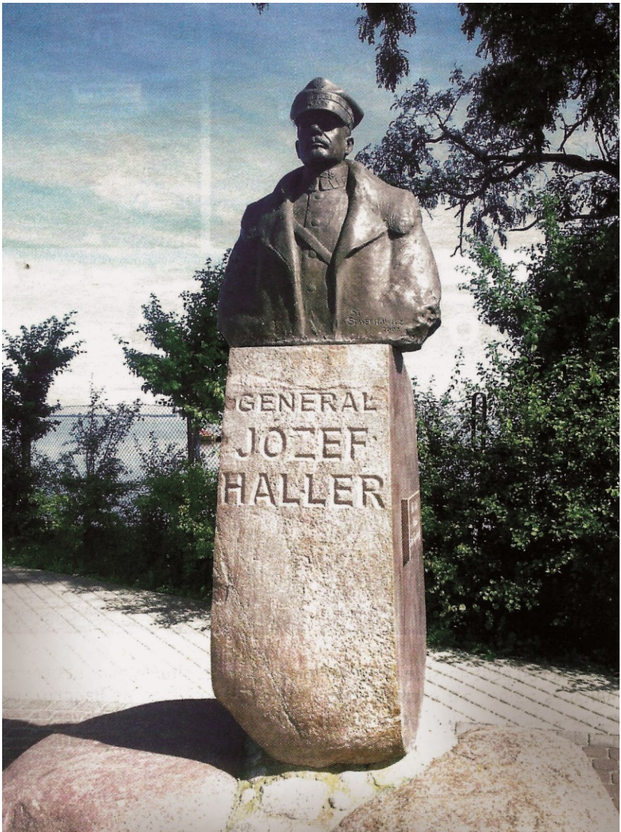
En Pologne, une statue honore la mémoire du général Haller à Puc.

L'Association des Volontaires Tchécoslovaques en France remercie cordialement l'association "Le Souvenir Français" pour l'avoir autorisée à reproduire l'article intitulé "L'Armée bleue" qui était paru dans son numéro 530, en avril 2023